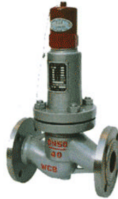
水平式液相安全回流阀 AH42F-P18