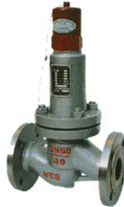
水平式液相安全回流阀 AH42F-P18