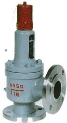
立式液相安全回流阀 AH42F-16C 25 40

该阀门适用于工作温度-40 ~ +80 液化石油气泵出口的液相回流管道上,用于超压介质的安全回流,当泵前压力超过规定值时,阀门自动开启,并起安全回流入罐,能保证设备和管路的安全运行。