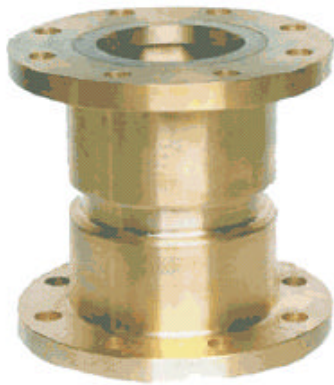
Y43X-16T (全铜) 比例式减压阀