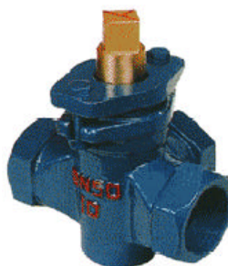
X14T-1.0 三通铜芯内螺纹旋塞阀