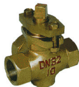
X14W-1.0T 三通内螺全铜旋塞阀