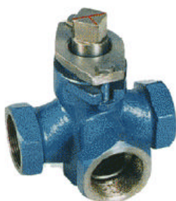
X14W-1.0C/P 三通内螺不锈钢旋塞阀