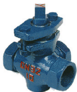
X14W-1.0 三通铸铁内螺纹旋塞阀