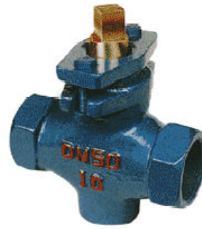
X13T-1.0 二通内螺铜芯旋塞阀