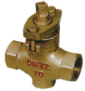
X13W-1.0T 二通内螺全铜旋塞阀