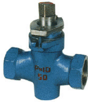
X13W-1.0P 二通内螺不锈钢旋塞阀