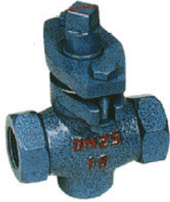
X13W-1.0 二通内螺铸铁旋塞阀