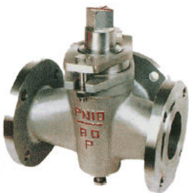
X44W-1.0P/R 三通不锈钢旋塞阀