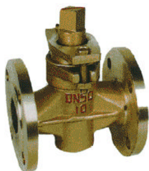
X43W-1.0T 三通全铜旋塞阀 主要性能规范