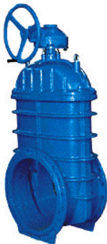
伞齿轮弹性座封闸阀