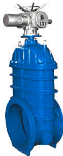
电动式弹性座封闸阀