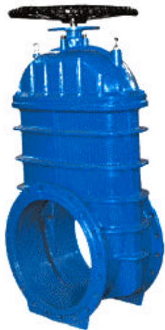
手轮式弹性座封闸阀