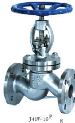
J41W-16 P R